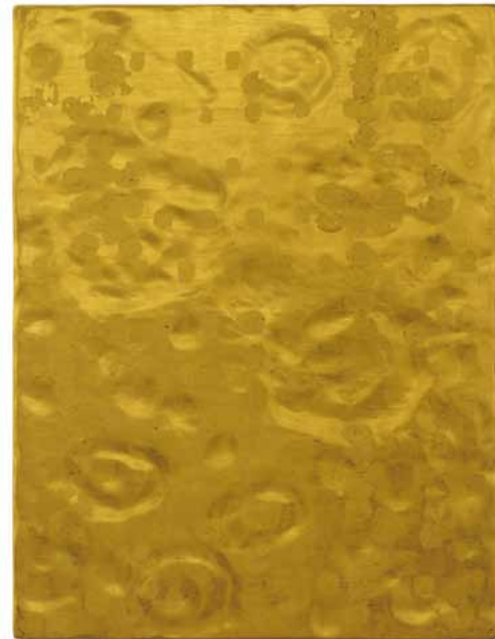
YVES KLEIN Le silence est d'or 1960, feuilles d'or sur panneau de bois, 148 x 114 cm.

Avec son Institut Culturel, le propriétaire de vignobles prestigieux souhaite créer une fondation qui s'inspire du mode de fonctionnement de la Villa Médicis. Ici l'objectif est de donner du temps et des moyens aux artistes. Il nous explique ses motivations et sa passion pour l'art.