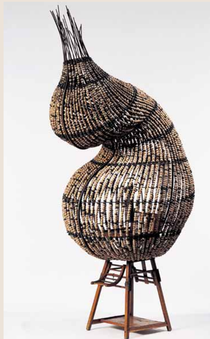
CHEN ZHEN Cocon du vide 2000, perles de bouliers et chapelets bouddhistes, chaise chinoise, métal, haut. 240 cm.