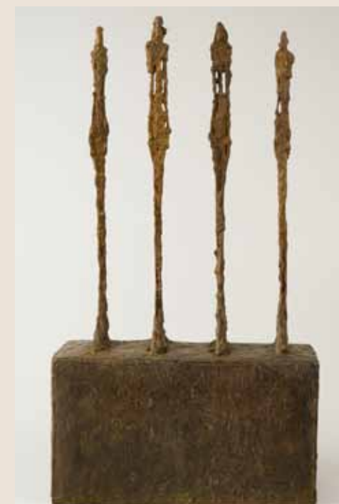
ALBERTO GIACOMETTI Quatre Femmes sur socle 1950, bronze, 73,8 x 41,2 x 18,8 cm. © Succession Giacometti / ADAGP Paris 2011. Collection Fondation Giacometti.