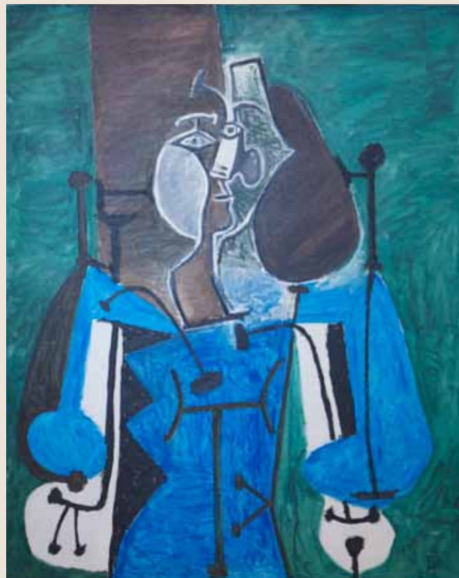
PABLO PICASSO Femme assise 1949, huile sur toile. © Succession Picasso 2011. Collection Odermatt-Vedovi.