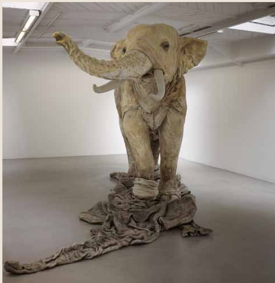
HUANG YONG PING Ombre blanche 2009, peaux de buffles sur structure en acier et résine, 250 x 450 x 210 cm. Vue de l'exposition «Caverne 2009», galerie Kamel Mennour, Paris. © ADAGP Paris 2011 / Huang Yong Ping. Photo André Morin. Courtesy de l'artiste et de la galerie Kamel Mennour, Paris. Collection Yuz Foundation.