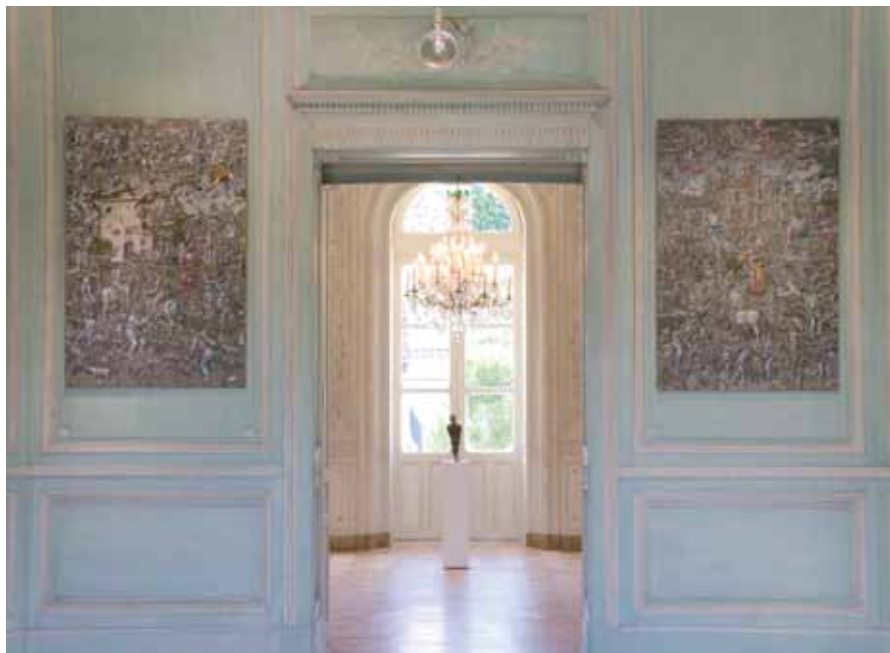
Nebojsa Bezanic La Tour Carnet , 2010 Pape Clément , 2010 Commandes de l'Institut Culturel Bernard Magrez Peinture à l'huile sur papier canson