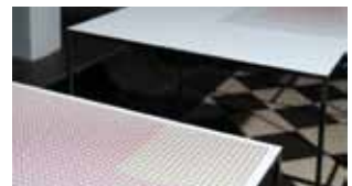
Alexandra Valois Casa Magrez , 2011 7 sérigraphies sur support rigide