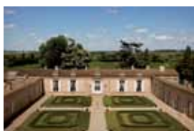
Château Fombrauge La Musique Classique & Sacrée