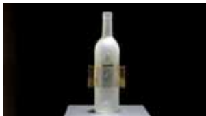
Julia Garret Brumes , 2011 Bouteille de 75 cl en verre blanc dépoli, excepté deux réserves claires, gravure, écusson, grille en laiton