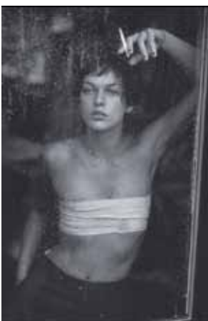
Peter Lindbergh Milla Jovovitch, Vogue Italie , 1996 Epreuve gélatino- argentique sur papier baryté 90 x 60 cm Tirage n°16/25 Galerie Polka