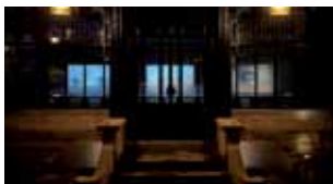
Charlotte Villard La part des Anges , 2011 Installation audiovisuelle 3 écrans de projections