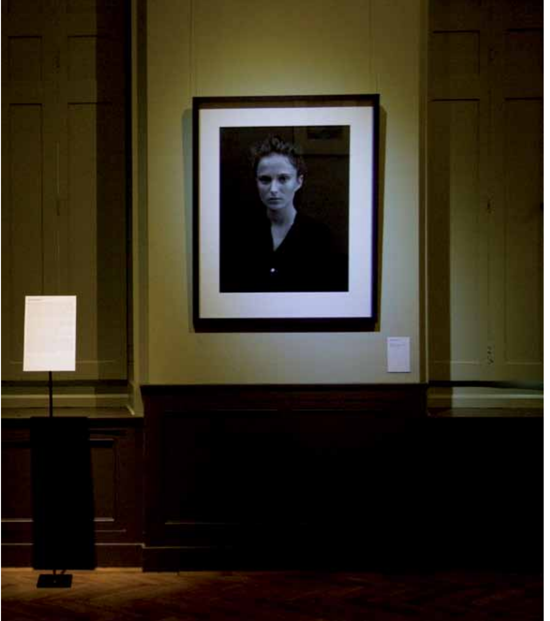
André Carrara Cathy , 1997 Photographie, tirage sur support baryté contrecollé