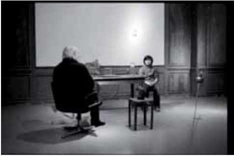
Jamais Renoncer , 2011 Commande de l'Institut Culturel Bernard Magrez Vidéo et photographie

Vidéo et photographie, commandées à l'artiste par l'Institut Culturel Bernard Magrez