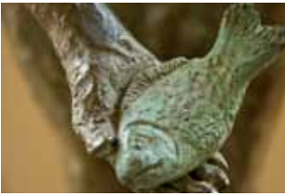
Ménis le pêcheur , 1997 Bronze, 48 x 15 x 18 cm

La carrière de Martial Raysse connaît un tournant après 1968. Jusque-là en effet, l'artiste s'était concentré sur une pratique que l'on a pu caractériser de « pop ». Usage des néons, du plastique, toiles reflétant le climat propre des années 1960 et la proximité engagée par l'art avec le monde publicitaire ou commercial : Martial Raysse développait clairement un discours critique sur cette période si particulière. Il participe aux événements de mai 1968 par le biais de l'atelier des affiches de l'École des beaux-arts de Paris, et dans la foulée se détourne de la peinture pour se concentrer sur le cinéma. Il voyage et s'éloigne du monde de l'art, qu'il ne retrouve qu'en 1974, date de son « retour » pour une exposition parisienne intitulée « Coco Mato ».