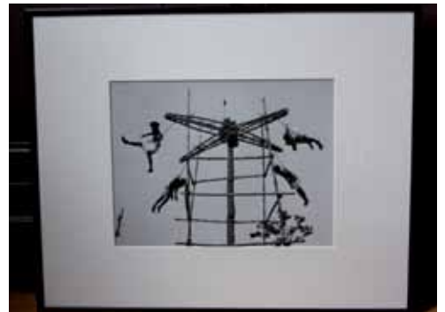
Paul Almasi Le carrousel de la Mort , 1950 Photographie, tirage argentique

Pour saisir cette vérité, Paul Almasy (né en 1906) se méfie à contrario de toutes sortes de mises en scène artistiques. Aborder la crudité de la réalité en renonçant à tout artifice permet peut-être de se résigner, de « supporter l'inévitable ». Almasy accepte en effet de prendre en charge ce poids et de lui donner un support: ses photographies. Semblables face à la misère, la violence, la maladie, la vieillesse et la mort, les réactions des hommes y révèlent « l'universalité de l'âme humaine » (interview filmée, Chambre noire , 1966).