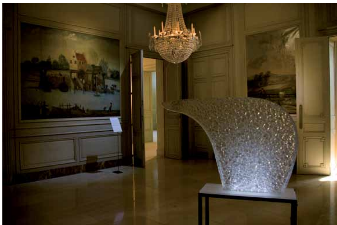
Livio Benedetti L'Ours , 2010 Sculpture en verre

Inséré dans ce paysage, l'Ours en verre soufflé et taillé par un maître verrier près de Chambéry, est l'œuvre de l'artiste français Livio Benedetti. Réalisé à partir d'une image véritable, l'animal adopte les traits simplifiés par l'imagination d'un artiste autodidacte. Cet ami d'Hugo Pratt, invite l'ours polaire dans son bestiaire de sculptures animalières (taureaux, antilopes, chevaux), comme un totem absolu de l'ailleurs et du voyage lointain.