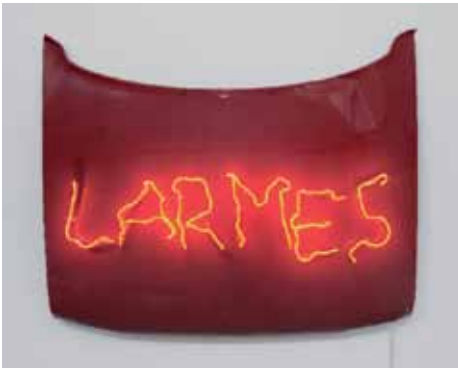
Claude Lévêque Larmes , 2011 Capot de voiture rouge, néon rouge Capot : 108 x 134 cm Néon : 30 x 108 cm Galerie Kamel Mennour