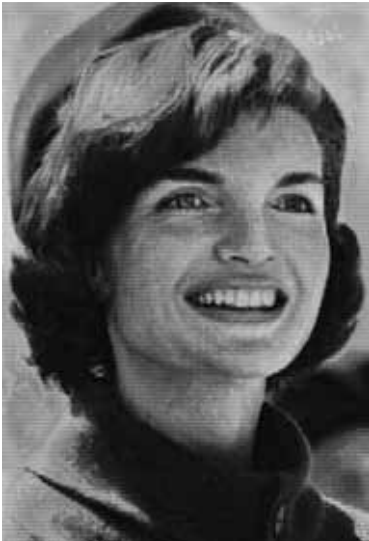
Alex Guofeng Cao Jackie vs JFK II , 2010 Epreuve à développement chromogène sur plexiglas et dibond 152.4 x 101.6 cm