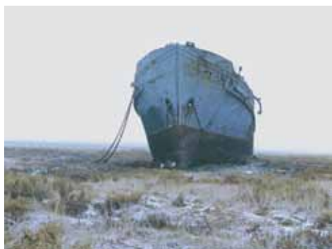
Untitled (série Mer d'Aral 6/10)

Série Mer d'Aral: les Bateaux qui pleurent , 2000