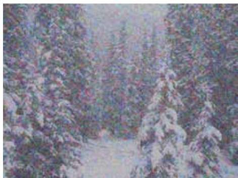
Colorado Snow Effect 5, 2008 Huile sur toile 122 x 162 cm

Dan Hays a fait le double choix de la tradition et de la modernité, de la technique ancienne de la peinture à l'huile associée à des contenus issus des médias contemporains. Le monde actuel se livre le plus souvent par le biais des écrans des télévisions ou d'Internet. Dan Hays prend en compte cette réalité, sans renoncer pour autant à son désir d'évasion de ce royaume des images. Ils ont pu les découvrir lors d'expositions personnelles, dans des galeries londoniennes, mais aussi à Paris et à New York grâce à Galerie Zürcher. Des ouvrages de Dan Hays ont aussi figuré au sein d'expositions collectives, notamment en Asie, avec le Japon, la Chine et la Corée, entre 2003 et 2006. Ils étaient également représentés en 2007 au Musée Marmottan à Paris et en 2008 au Museum of Fine Arts de Houston.