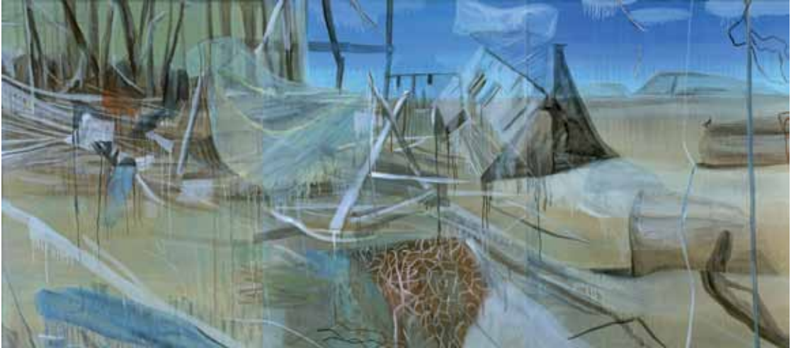
Marc Desgrandchamps Sans titre , 2008 Triptyque Huile sur toile 200 x 450 cm Galerie Zürcher