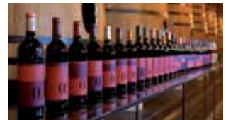
Julie Regazzacci Gamme #2 , 2011 2 séries de bouteilles de vins étiquetées 31 bouteilles de vin rouge / 5 bouteilles de vin blanc