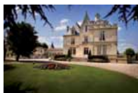
Château Pape Clément Les événements spéciaux Colloques & Rencontres

- À l' Hôtel Labottière , hôtel particulier du XVIII e siècle au cœur de Bordeaux, pour des expositions d'œuvres modernes et contemporaines, issues de collections publiques ou privées et des productions artistiques réalisées dans le cadre des résidences d'artistes de l'Institut Culturel.