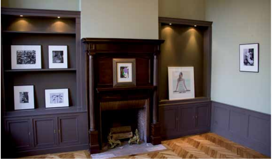
Paul Almasy Brazzaville , 1960 Paris-clochards , 1956-1972 Paris-clochards , 1956-1972 Le carrousel de la Mort , 1950 Tirage argentique