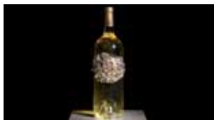
Benjamin Rolin La noblesse de la pourriture , 2011 Magnum de « Sauternes de ma fille », médaillon de perles de verre en laiton