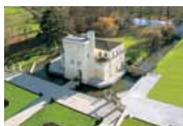
Château La Tour Carnet Les Écritures Littérature & Pensée