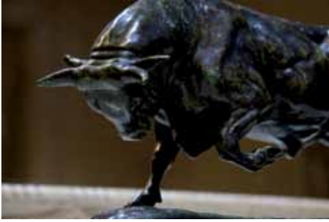
Antoine-Louis Barye Taureau chargeant Bronze à patine noire

« À 16 ans, je découpais dans les revues d'art les photos des tableaux de Van Gogh et surtout ses auto-portraits. J'étais fasciné par la profondeur de son regard où, pour moi, se concentrait sa vie tumultueuse.