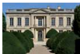
Hôtel Labottière Résidences d'artistes & Expositions d'arts visuels