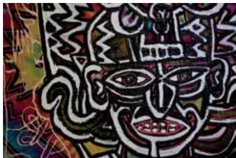
Robert Combas Divinités , 2001 Acrylique sur soie

un premier accrochage d'une partie de la collection avril / septembre 2011