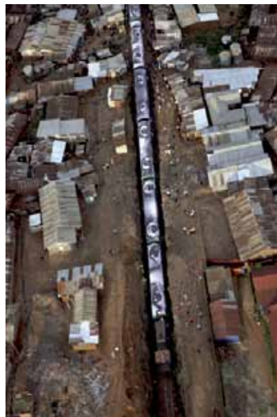
JR Vertical train through Kibera , 2009 Photographie couleur, plexiglas, aluminium, bois 270 x 180 cm Galerie Emmanuel Perrotin